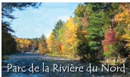
Parc de la Rivière du Nord 750, chemin Rivière-du-Nord Saint-Jérôme (Québec) J7Y 5G2 450 431-1676

Le Parc régional de la Rivière-du-Nord est un site enchanteur vous permettant de découvrir un patrimoine culturel et naturel. Le parc, régit par les villes de Prévost, St-Hippolyte, St-Jérôme, Ste-Sophie et St-Colomban, est une invitation irrésistible à venir goûter les plaisirs de la nature tout en éveillant vos sens d'observation, d'orientation et d'interprétation. Le parc est idéal pour pratiquer des activités de plein air en toutes saisons grâce à un réseau de sentiers totalisant 43 km.