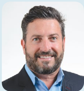
Bruno Laroche, maire

Prenez note que la prochaine séance du conseil municipal aura lieu le lundi 13 novembre à 19h à l'église paroissiale, 2261, chemin des Hauteurs. On peut consulter les procès-verbaux de toutes les séances ou visionner les vidéos de celles-ci en visitant le saint-hippolyte.ca .