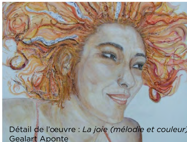
Détail de l'oeuvre : La joie (mélodie et couleur) Gealart Aponte