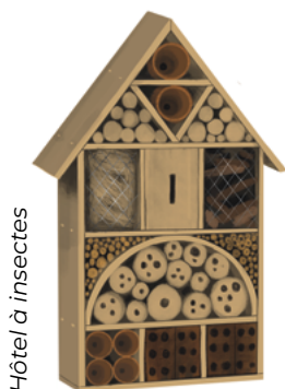
Hôtel à insectes

À 12 h, une conférence sur la protection des eaux souterraines et le projet de suivi de la nappe phréatique vous sera présentée par un membre de l'équipe de chercheurs de Polytechnique Montréal, dirigée par la professeure Dominique Claveau-Mallet.